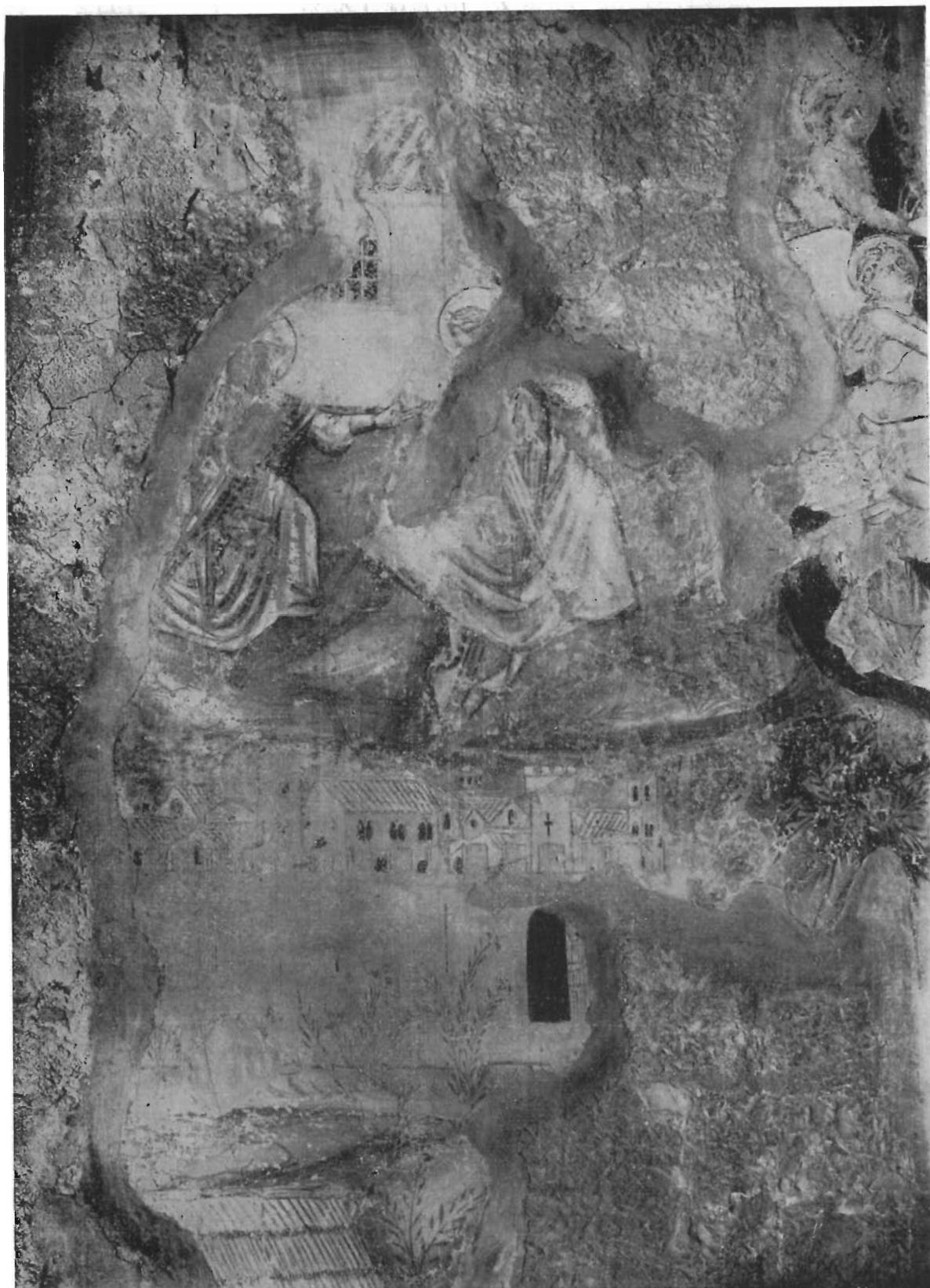
FIG. 4 - GUBBIO, CHIOSTRO DI S. FRANCESCO - PIETRO COLEBERTI; Affresco ( particolare ).