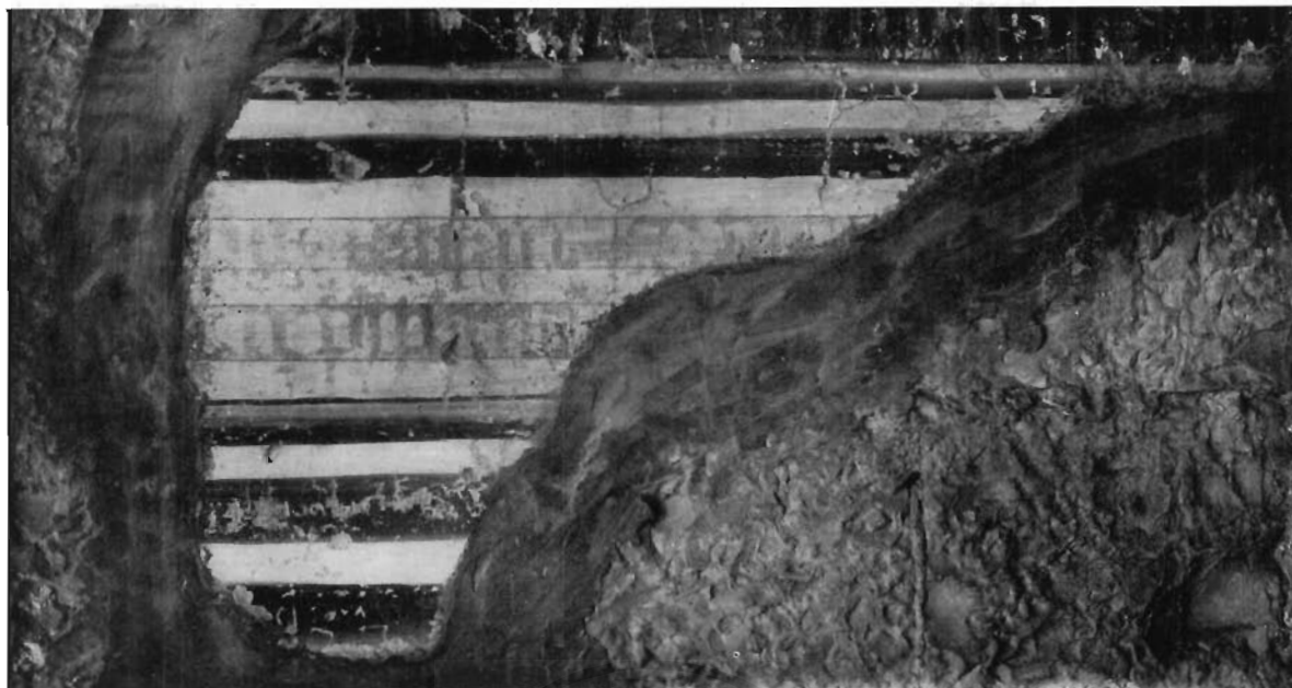
FIG. 6 - GUBBIO, CHIOSTRO DI S. FRANCESCO - PIETRO COLEBERTI: Affresco (particolare con la scritta).

Ma vediamo se ci riesce (e questo vuol essere il fine del mio lavoro) di stabilire qualche cosa di preciso sulla paternità e sulla data dell'affresco: indagine, questa, pressoché trascurata sino ad oggi, essendosi ogni interesse concentrato sul problema iconografico 12) .