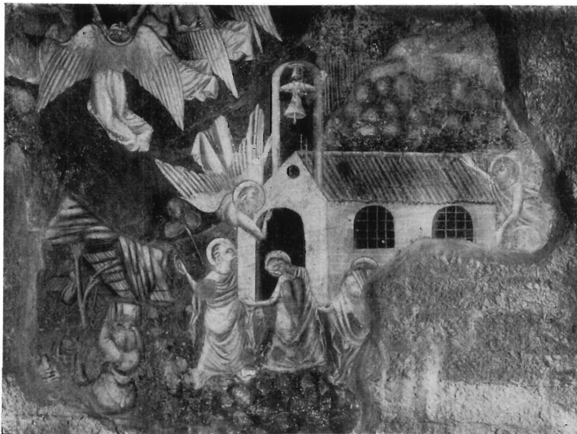
FIG. 3 - GUBBIO, CHIOSTRO DI S. FRANCESCO - PIETRO COLEBERTI: Affresco (particolare).

boscelli dalle foglie lanceolate, forse piccole piante di lauro; sotto le mura, verso il margine sinistro dell'affresco, s'intravedono i resti di una capanna, di un pastore, di un gregge di pecore racchiuso entro uno stazzo (fig. 4).