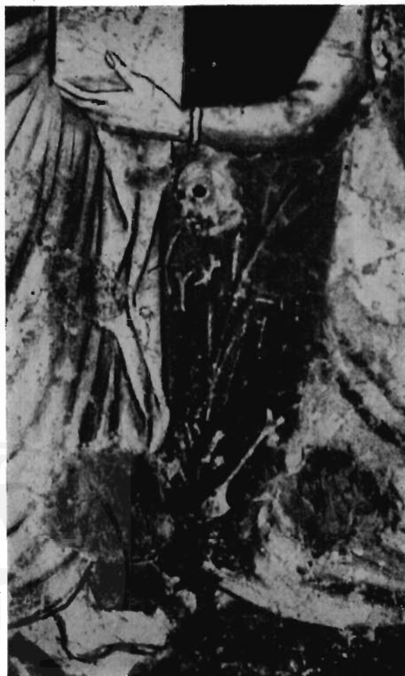
FIG. 5 - GUBBIO, CHIOSTRO DI S. FRANCESCO - PIETRO COLEBERTI: Affresco (particolare).

gerli tra i due angeli che sono sul davanti dell'edificio, e precisamente sotto il braccio di quello di sinistra che sorregge con il palmo della mano lo spigolo come per dare un avvio al volo (fig. 5). Nei resti in parola si son volute veder indicate « le atrocità commesse contro i pellegrini accorsi a venerare la S. Casa », durante la sosta di otto mesi fatta da questa nella selva di Recanati, in pianura tra il Musone e l'Aspio, luogo che, per essere infestato in antico da banditi, tuttora conserva il nome di Bandirola 9) . A ricordare gli omicidi perpetrati nella selva infame l'artista sicuramente non si sarebbe limitato a dipingere i resti di un solo individuo umano, ma avrebbe moltiplicato le prove dell'effertezza di quegli scellerati che infestavano il luogo. È invece probabile che il teschio e le altre ossa abbiano un diverso significato: se l'ipotesi che io affaccio sembrerà accettabile, si avrà un ottimo argomento in più a conferma dell'interpretazione in senso lauretano dell'affresco. È noto che per tutta l'età di mezzo rimase si può dire abituale la figurazione del teschio di Adamo